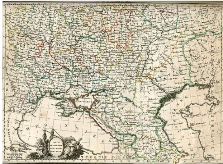
N° 171 : Atlas complet du précis de géographie universelle de M. Malte-Brun

Les ordres d'achat doivent nous parvenir, au plus tard, le jeudi 20 février avant 18 h. Merci de votre compréhension.