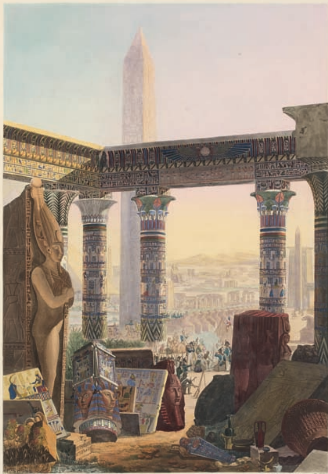
FAC-SIMILE DES MONUMENS COLORIÉS DE L'EGYPTE D'APRÈS LE TABLEAU DE F. C. F. PASCHEUX.

Cherbourg de la Librairie de l'Égypte, Librairie de la description de l'Égypte, 2 e édition.