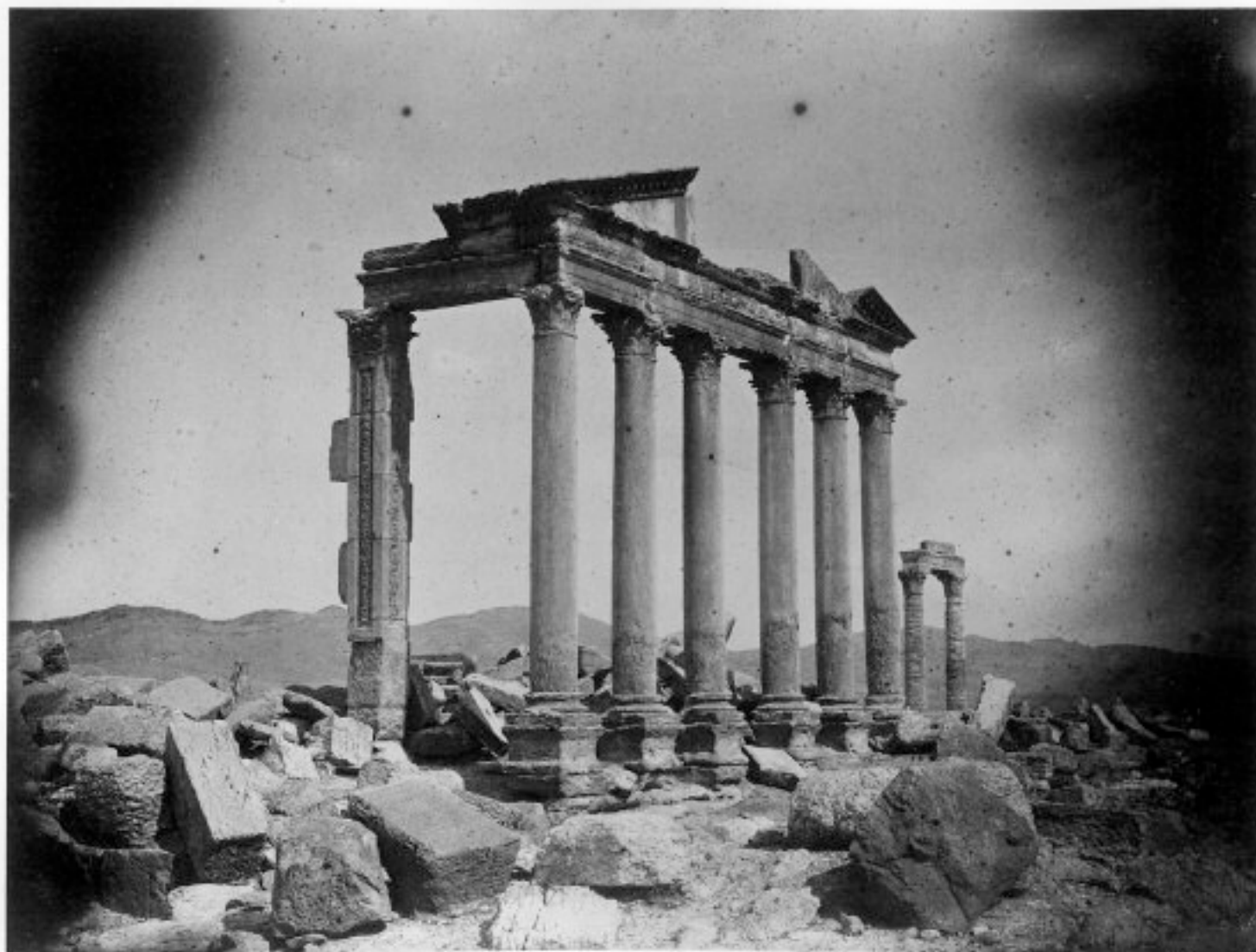
Mausolée à l'apéciride' Ouest de la colonnade - Palmyre