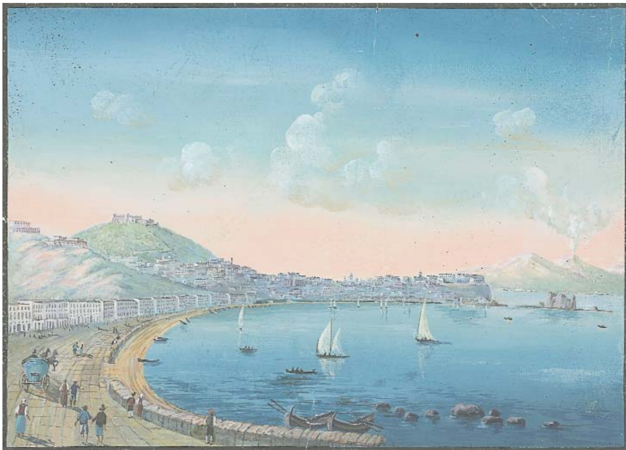
38 illustration de l'une