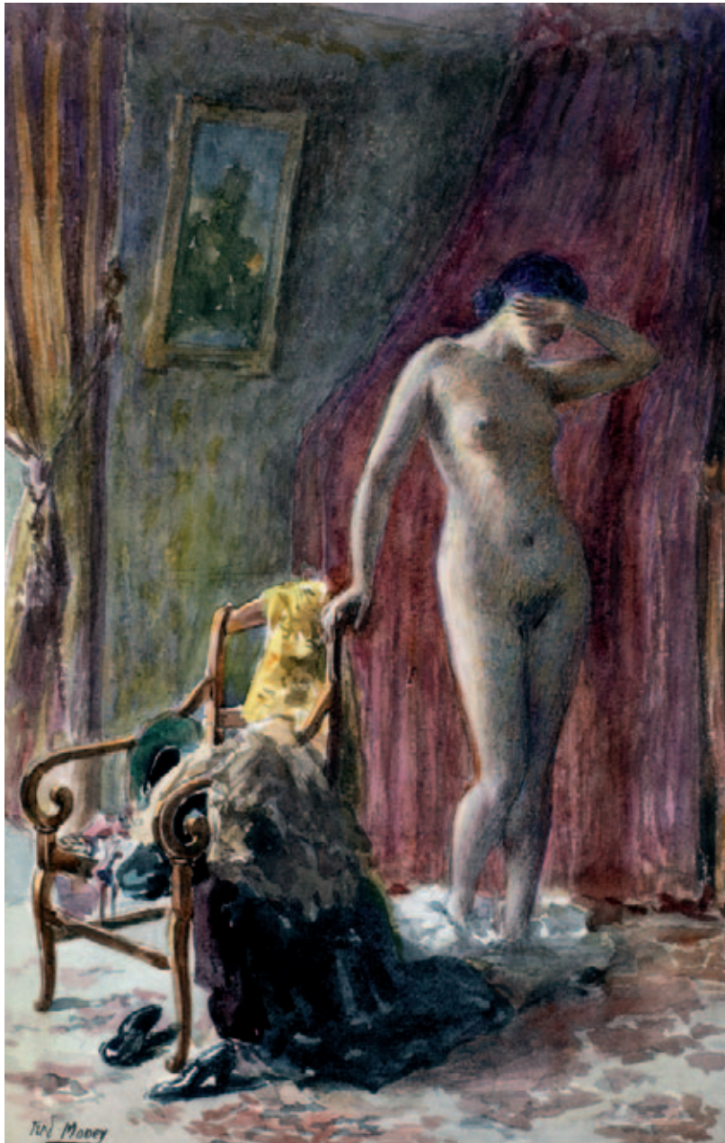
Flaubert, Madame Bovary , 106