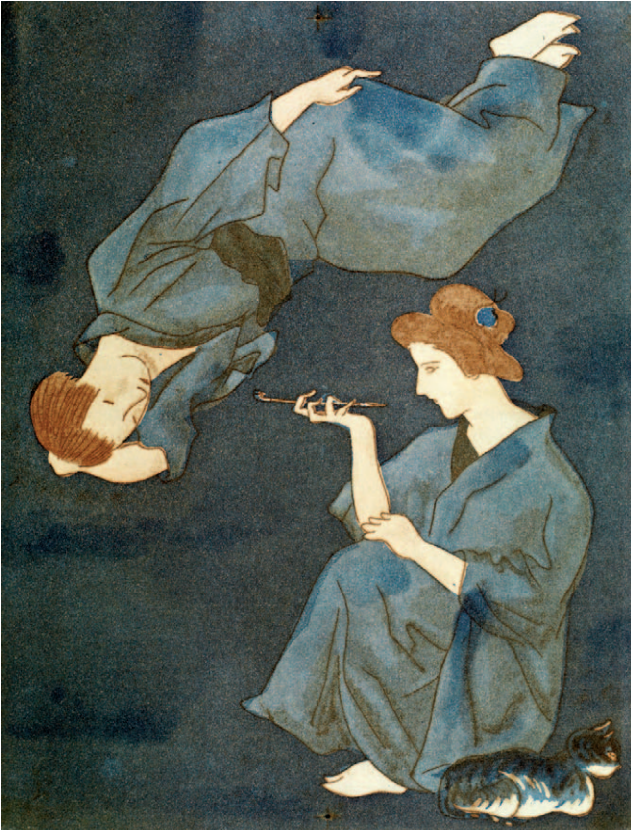
Loti illustré par Foujita, 128