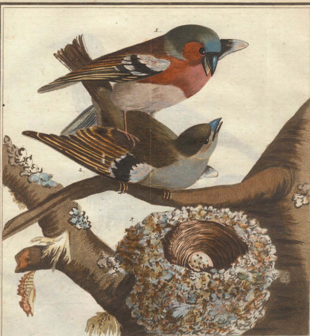
Der gemeine Fink. Fringilla coelebs Lin. 1. Männchen 2. Weibchen 3. Nest.