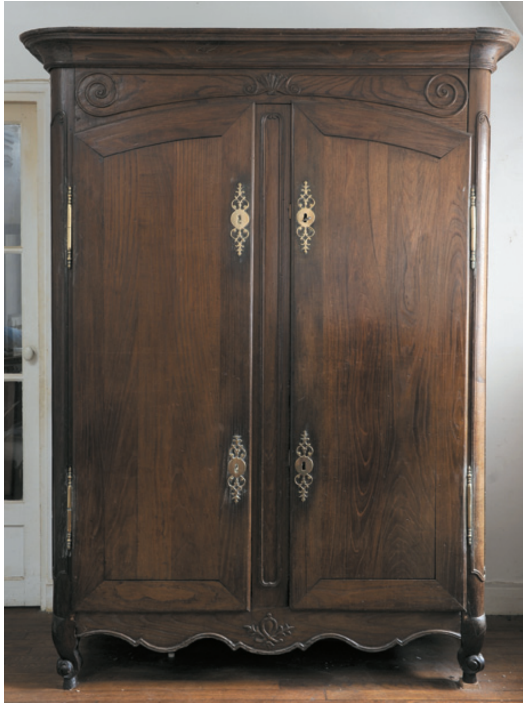
189 - ARMOIRE en chêne mouluré et sculpté de feuillages et enroulements. Côtés parquetés. Elle repose sur des pieds coquilles. Travail malouin du milieu du XVIII e siècle. 218 L. 160 P. 75 cm 1 000/1 200