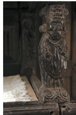
178 - LIT CLOS en chêne mouluré et sculpté à riche décor géométrique composé de portes, d'un lit à colonnes, et d'un buffet à consoles. Marqué P : INRI AF :F : 1635. (accidents et restaurations). XVII e siècle. H. 222 L. 423 P. 80 cm

Lit dit de Saint Yves PROVENANCE : Château de Coat-Trédrez. Installé à Kergist au XIX e siècle.