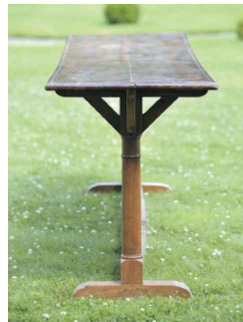
180 - LONGUE TABLE ÉTROITE de communauté en noyer. Elle repose sur deux colonnes réunies par une entretoise. XIX e siècle. H. 82 L. 292 P. 57 cm 1 500/2 000