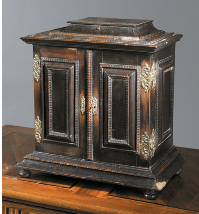
137 - PETIT CABINET en bois noirci, ouvrant à deux portes découvrant onze tiroirs et un tiroir dans la doucine. Il repose sur des pieds boule. XVII e siècle.