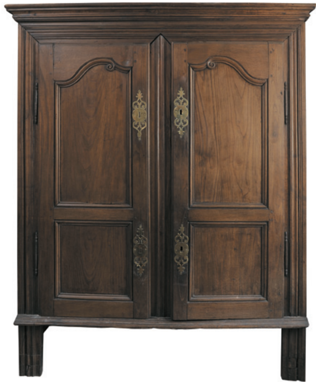
179 - ARMOIRE en chêne mouluré, cotés parqués. Elle repose sur des pieds droits. Travail malouin du milieu du XVIII e siècle. H. 181 L. 149 P. 57 cm 700/800