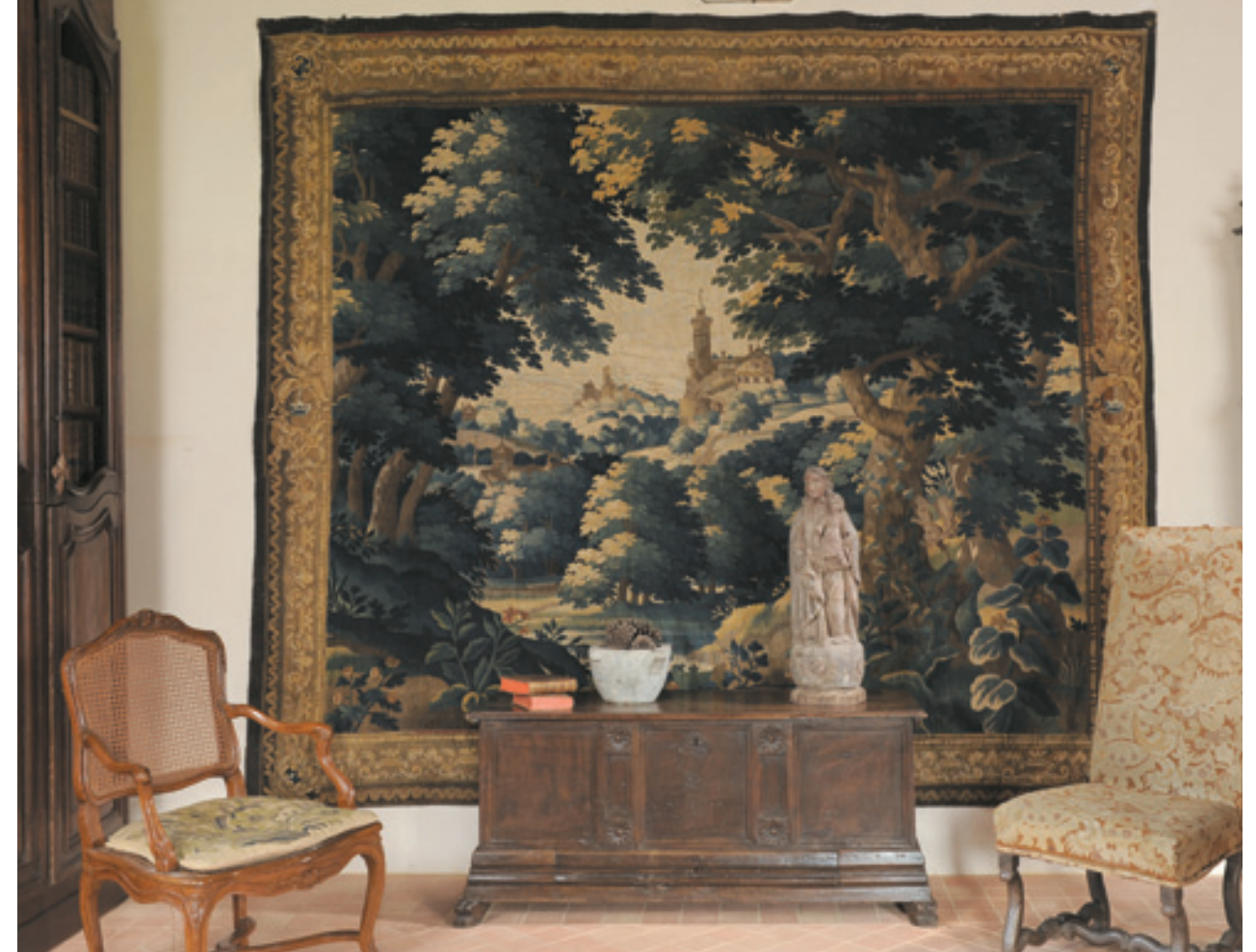
151, 133, 131, 134, 191

128 - PAIRE DE CARAFES EN CRISTAL gravées d'une couronne et chiffre du baron Gourgaud. (accidents).