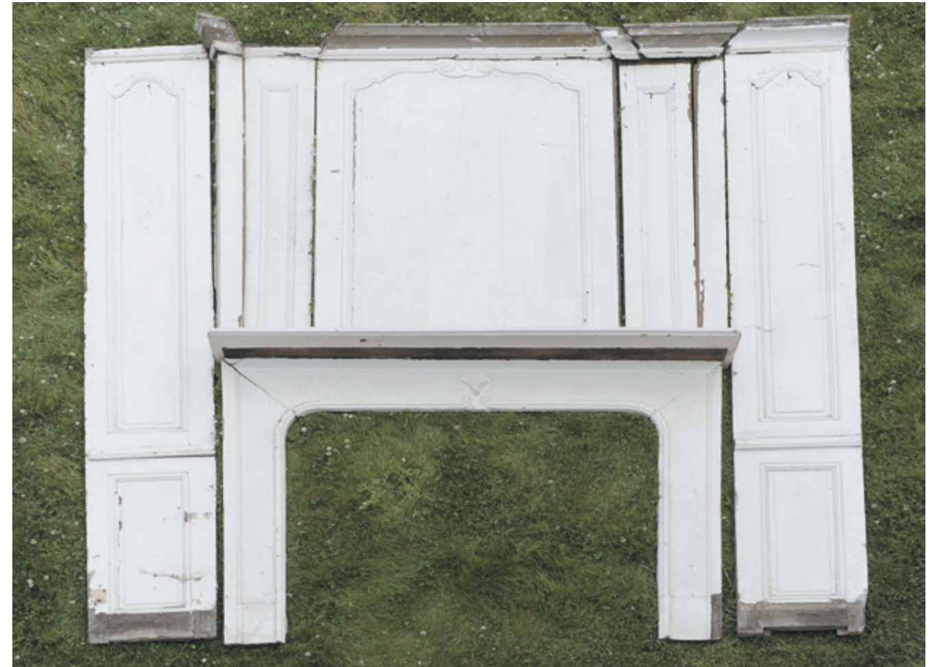
190 - CHEMINÉE, TRUMEAU ET SES COTÉS en chêne mouluré et relaqué. (accidents et manques). Epoque Louis XV. H. 256 L. 238 cm 1 200/1 500