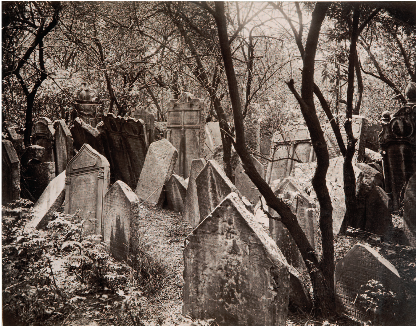
cimetière juif de Prague