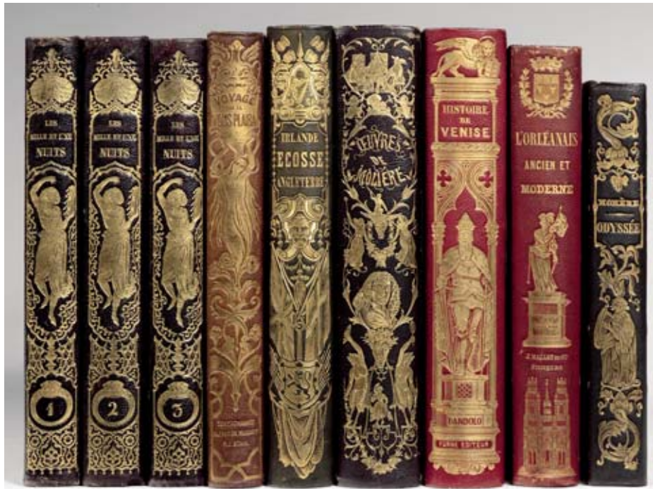
Exemplaires en chagrin d'éditeur