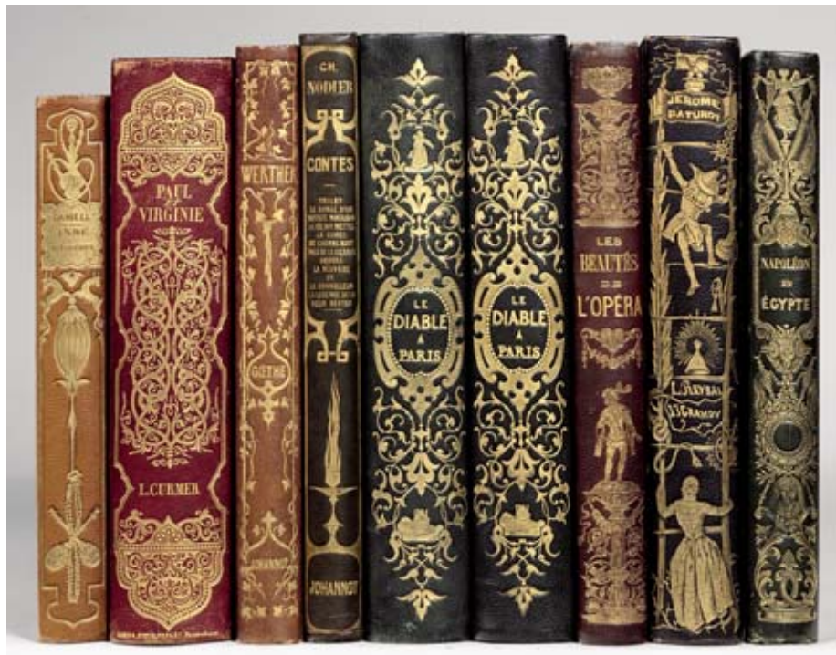
Exemplaires en chagrin d'éditeur