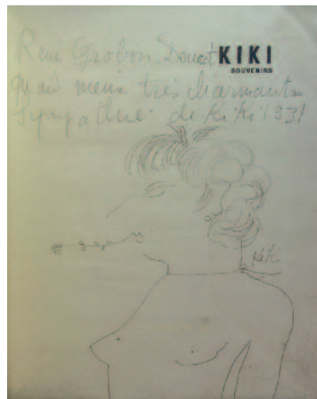
306. KIKI DE MONTPARNASSE. KIKI SOUVENIRS. Les Souvenirs de Kiki, préface de Foujita, ... Paris, Henri Broca, 1929 ; pet. in-4, édition originale d'un dessin et d'un envoi autographe