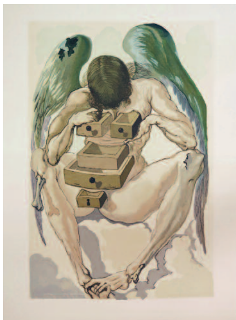
239. [DALÍ].— DANTE. LA DIVINE COMÉDIE. Paris, les Heures claires, 1963 ; 6 vol. in-4