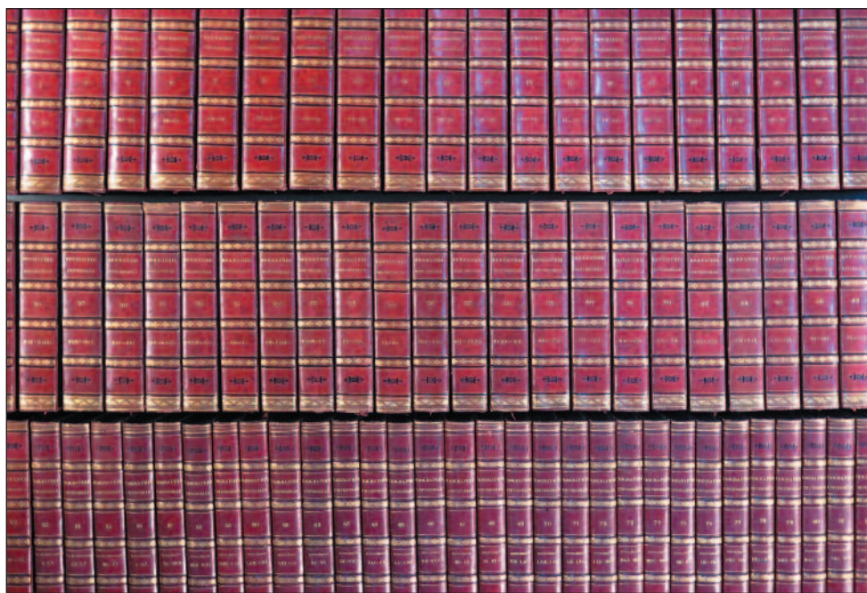
354. MICHAUD. BIOGRAPHIE UNIVERSELLE ANCIENNE ET MODERNE, Paris, Michaud frères, 1811-1828, 1832-1833, 1834-1862 ; 85 vol. in-8, demi-veau (sauf les 2 derniers vol. demi-chagrin) (détail)