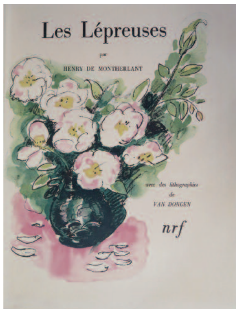
425. [VAN DONGEN].- MONTERLANT (Henry de). LES LÉPREUSES, AVEC DES LITHOGRAPHIES DE VAN DONGEN. Paris, N.R.F., 1946 ; in-folio, reliure mosaïquée