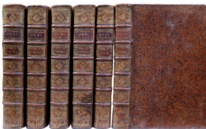
12. BRUZEN DE LA MARTINIÈRE (Antoine-Augustin). LE GRAND DICTIONNAIRE GÉOGRAPHIQUE, HISTORIQUE ET CRITIQUE. Paris, P.G. Le Mercier, 1739-1741 ; 6 forts vol. in-4