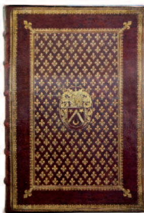
54. [MOLÉ], LES ORDONNANCES ROYALES SUR LE FAIT ET JURISDICTION DE LA PREVOISTE DES MARCHANDS, & eschevinage de la ville de Paris. Paris, P.Rocolet, 1644 (photo de couverture)