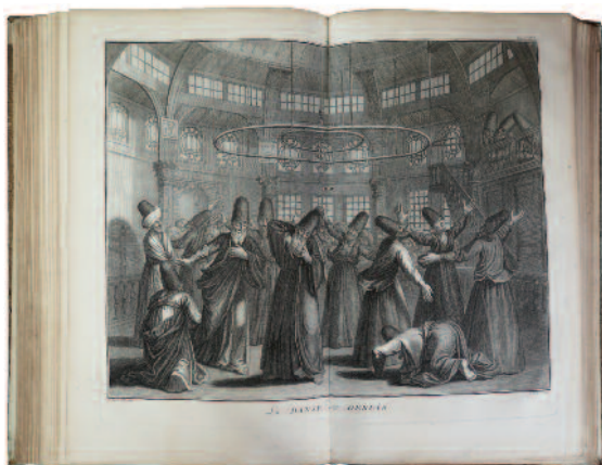
69. PICART (Bernard). CÉRÉMONIES ET COUTUMES RELIGIEUSES DE TOUS LES PEUPLES DU MONDE [...]. Amsterdam, Paris, Laporte, 1783 ; 4 vol. pet. in-folio