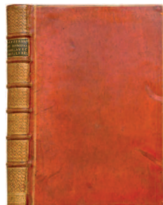
100. VIGOR (Simon), DUPUY (Pierre). HISTOIRE DU DIFFEREND D'ENTRE LE PAPE BONIFACE VIII ET PHILIPPE LE BEL, roy de France. Paris, Sébastien et Gabriel Cramoisy, 1655 ; in-folio, sur grand papier