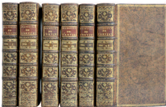
44. LABAT (Jean-Baptiste). MÉMOIRES DU CHEVALIER D'ARVIEUX, envoyé extraordinaire du Roy à la Porte, Consul d'Alep, d'Alger, de Tripoli, & autres échelles du Levant. Contenant : Ses voyages à Constantinople, dans l'Asie, la Syrie, la Palestine, l'Égypte, & la Barbarie, la description de ces Pais, les Religions, les mœurs, les Coutumes, le Négoce de ces Peuples, & leurs Gouvernemens, l'Histoire naturelle & les événements les plus considérables, recueillis de ses Mémoires originaux, & mis en ordre avec des réflexions. Paris, Jean-Baptiste Deslepine le fils, 1735 ; 6 vol. in-12, première édition