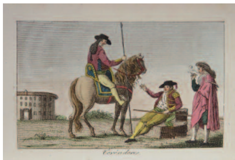
205. BRETON DE LA MARTINIÈRE (J.-B.). L'ESPAGNE ET LE PORTUGAL, ou mœurs, usages et costumes des habitants de ces royaumes, précédé d'un précis historique. Ouvrage orné de cinquante-quatre planches représentant douze vues et plus de soixante costumes différents, la plupart d'après des dessins exécutés en 1809 et 1810. Paris, A. Nepveu, 1815 ; 6 vol. in-18