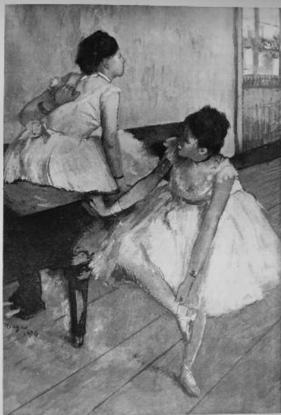
319. LEMOISNE (P. A.). DEGAS ET SON ŒUVRE. Paris, aux Arts et métiers graphiques, 1946-1949 ; 4 forts vol. grand in-4