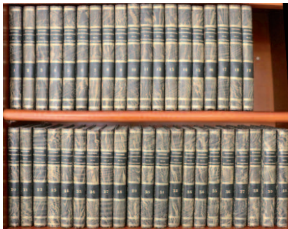
208. BUCHEZ (B.-J.-B.) et ROUX (P.-C.). HISTOIRE PARLEMENTAIRE DE LA RÉVOLUTION FRANÇAISE ou Journal des Assemblées Nationales depuis 1789 jusqu'en 1815. Paris, Paulin, 1834-1838 ; 40 vol. in-8