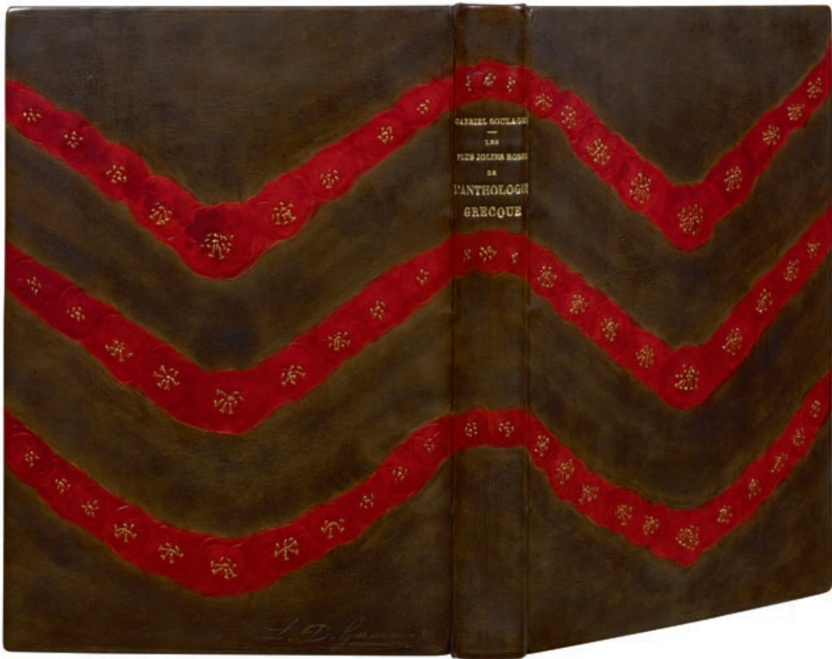
123 - Soulague - L.D. Germain