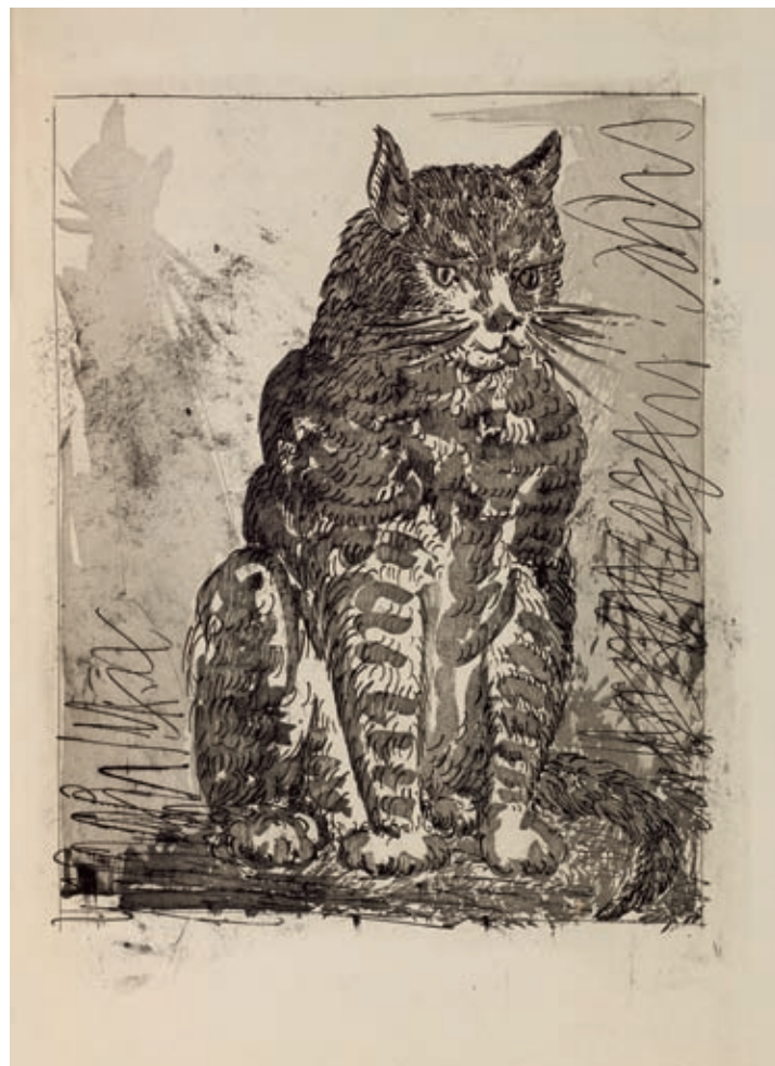
146 - Buffon - Picasso