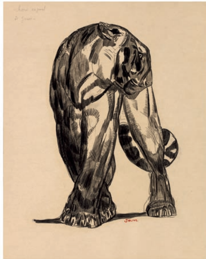
140 - Colette - Jouve. Dessin