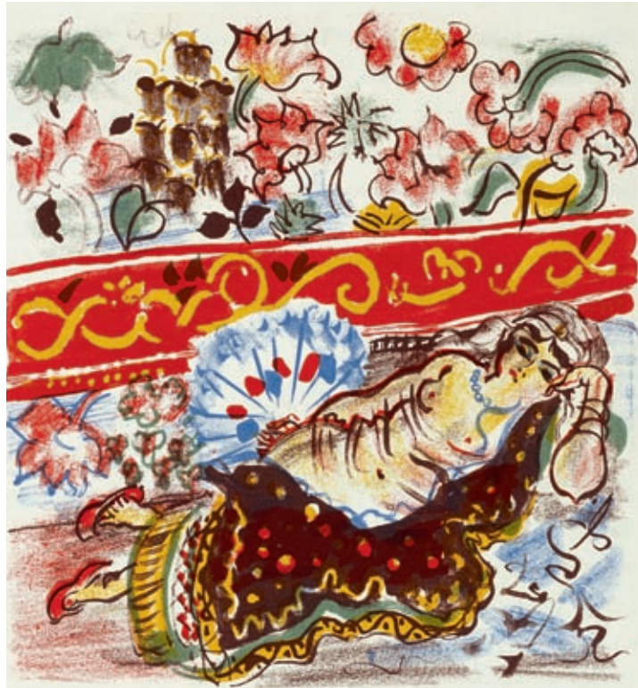
143 - Daudet - Dufy