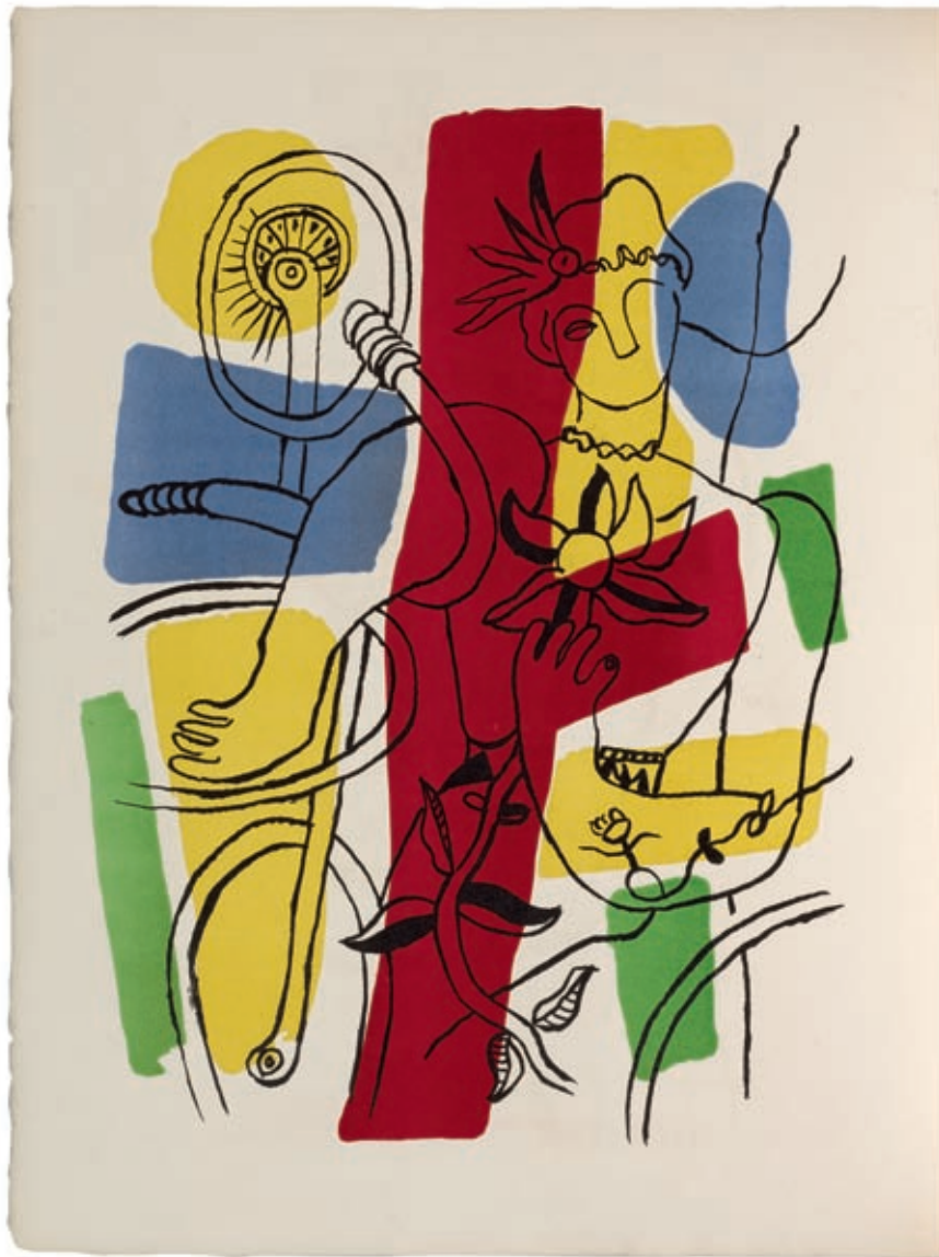
151 - Léger