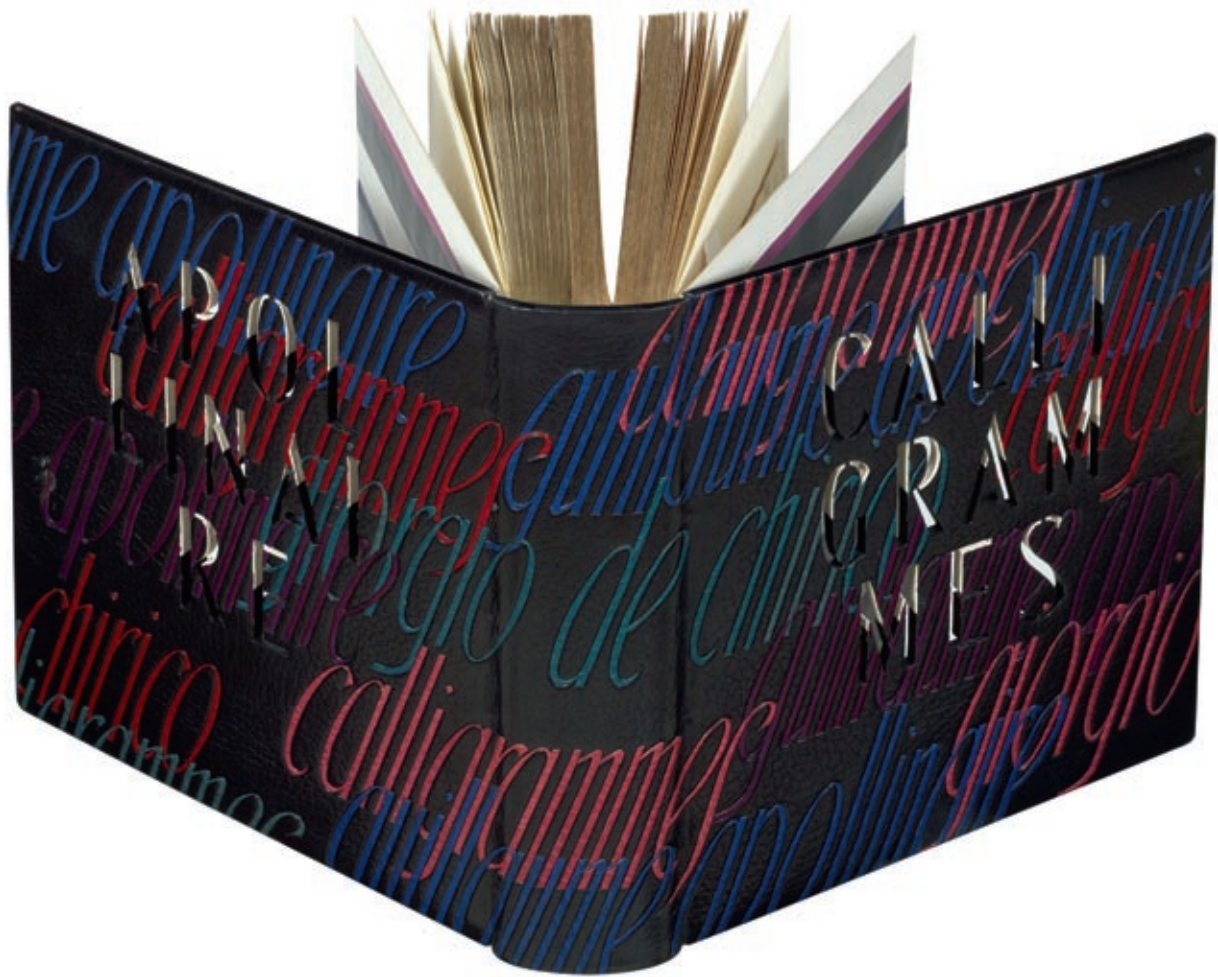
131 - Apollinaire - Chirico - Bonet