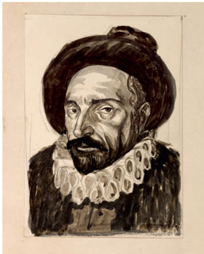
142 - Montaigne - Jou. Dessin