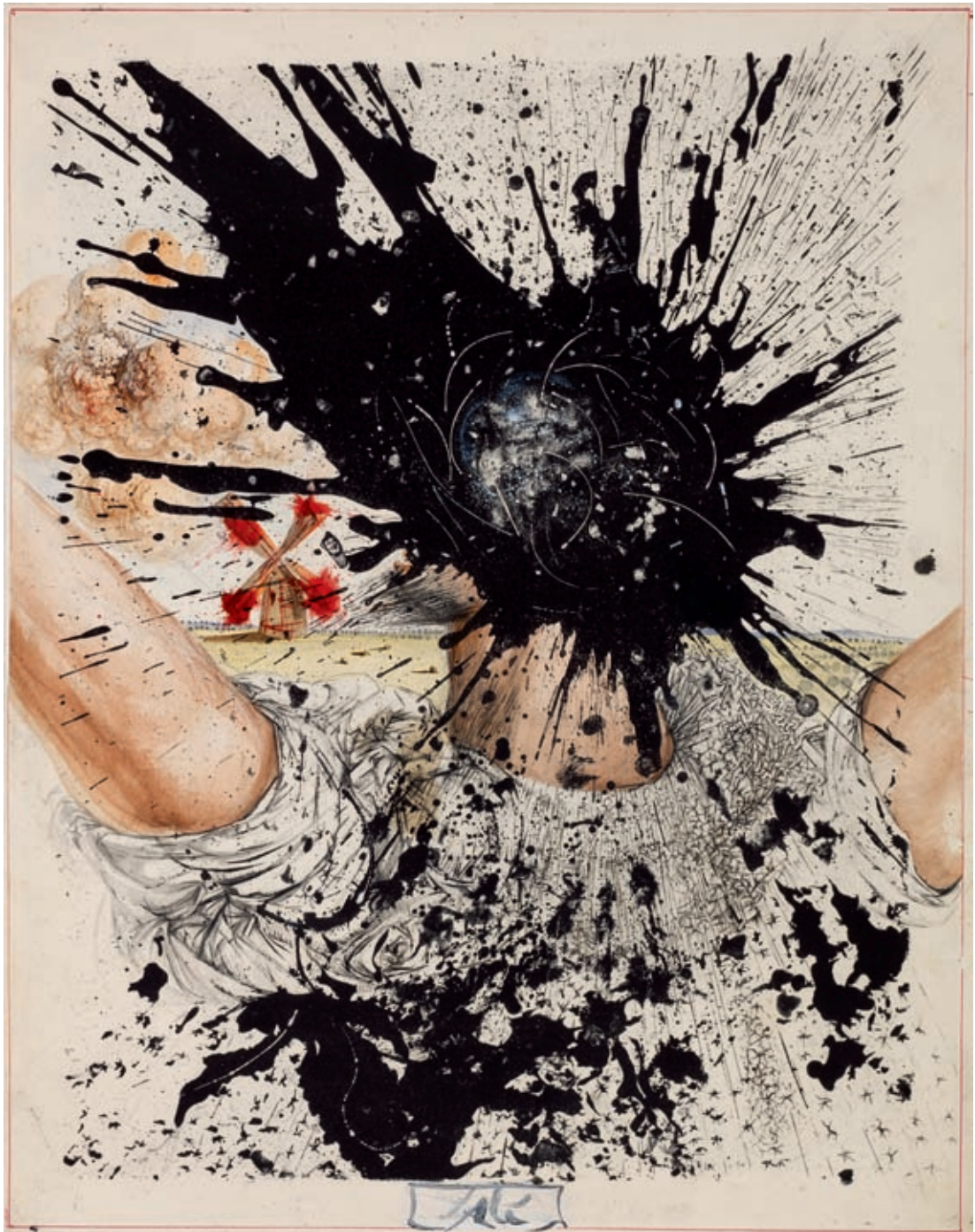
154 - Cervantes - Dali. Aquarelle