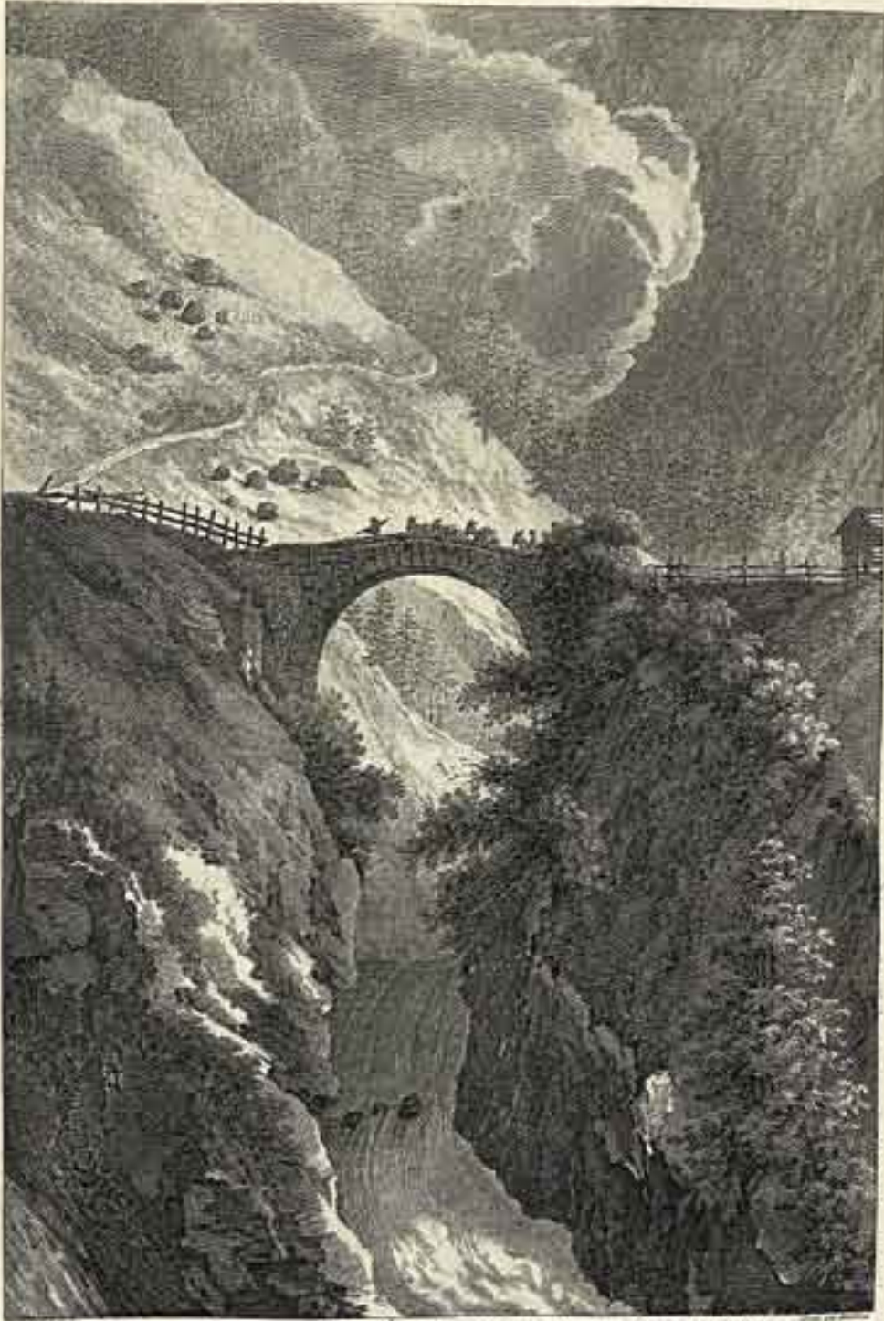
PONT SUR LA RUSS PRÈS LE VILLAGE DE MULTIRACK.