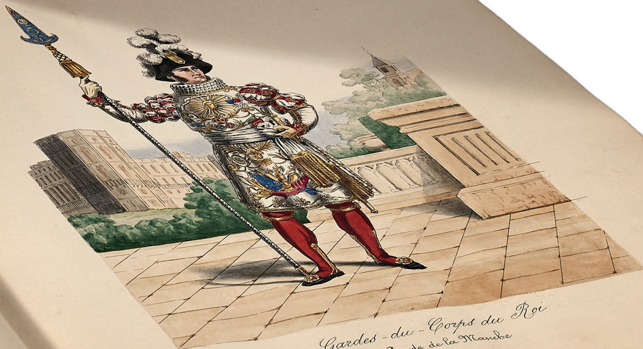
Gardes - du - Corps du Roi Garde de la Mante 1824 - 1830.