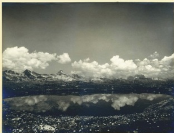
50mm x 75mm au format 1/35

Photographies signées : Man Ray, Steiner, Lehnert & Landrock, Choumoff, Dieuzaide