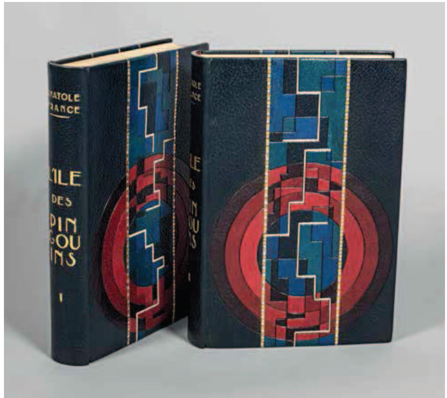
424 FRANCE ANATOLE - JOU LOUIS.

25 dessins d'un dormeur , v. 1930. (27 x 21 cm) Editions Mermod à Lausanne. Illustré de 25 reproductions en noir des dessins de Jean Cocteau représentant un jeune homme en train de dormir. Tiré sur les presses de l'Imprimerie Albert Kunding à Genève. Exemplaire no 10 de 200 sur vélin pur fil des Papeteries du Marais. Broché. CHF 300 | 400 € 250 | 330