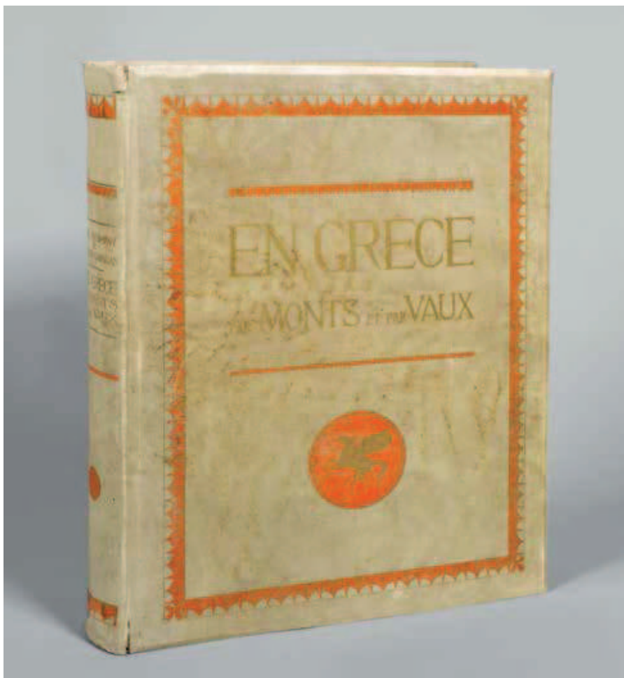
413 BAUD-BOVY DANIEL – BOISSONNAS FRÉDÉRIC.

Petits poèmes en prose , 1934, in-4. Société du Livre d'Art à Paris. Illustré de 38 eaux-fortes d'Alexeïeff. Un des 148 exemplaires sur vélin d'Arches. Broché, conservé sous chemise et étui. CHF 500 | 700 € 410 | 570