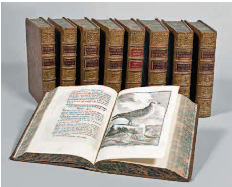
389 BUFFON COMTE DE.

Basane d'époque, dos lisse orné. Coiffes et queues frottées avec petits manques parfois. CHF 400 | 500 € 330 | 410