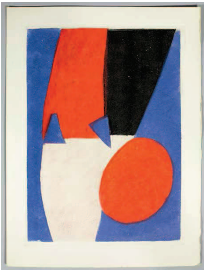
529 PLATON – POLIAKOFF SERGE.