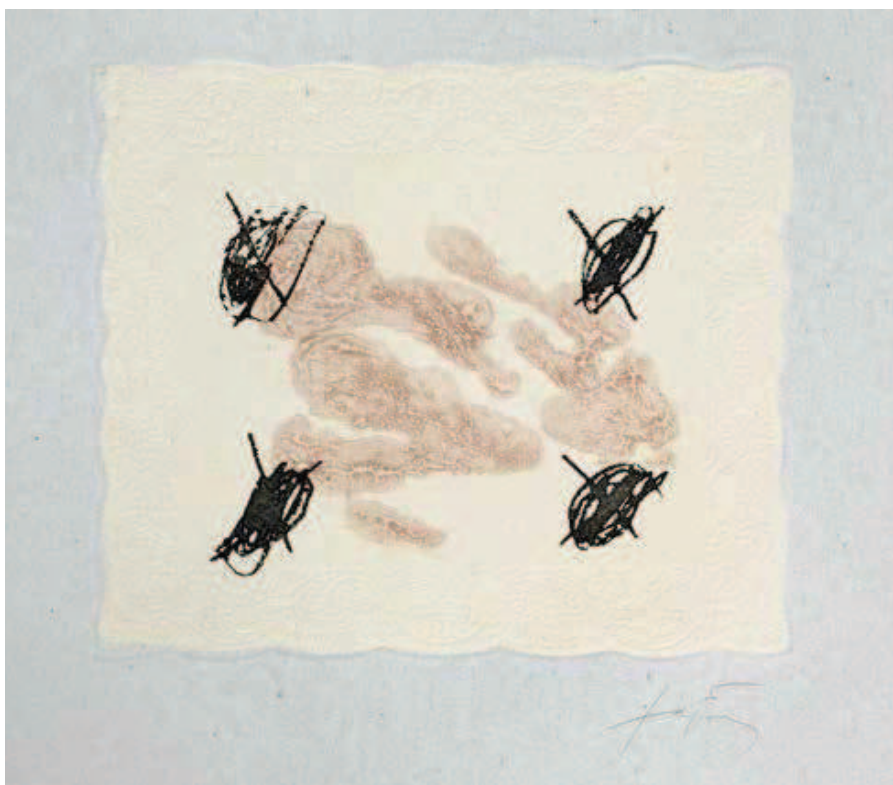
522 PAZ OCTAVIO – TAPIES ANTONI.

Gamiani , 1976, in-folio à l'italienne. Editions Plaisir du Livre à Vitry sur Seine. Suite libre sur papier Japon nacré des 12 gravures originales inspirées à Jean-Baptiste Valadié. Un des 125 exemplaires sur vélin d'Arches enrichi d'un envoi avec dessin signé. En feuilles sous chemise. CHF 300 | 400 € 250 | 330