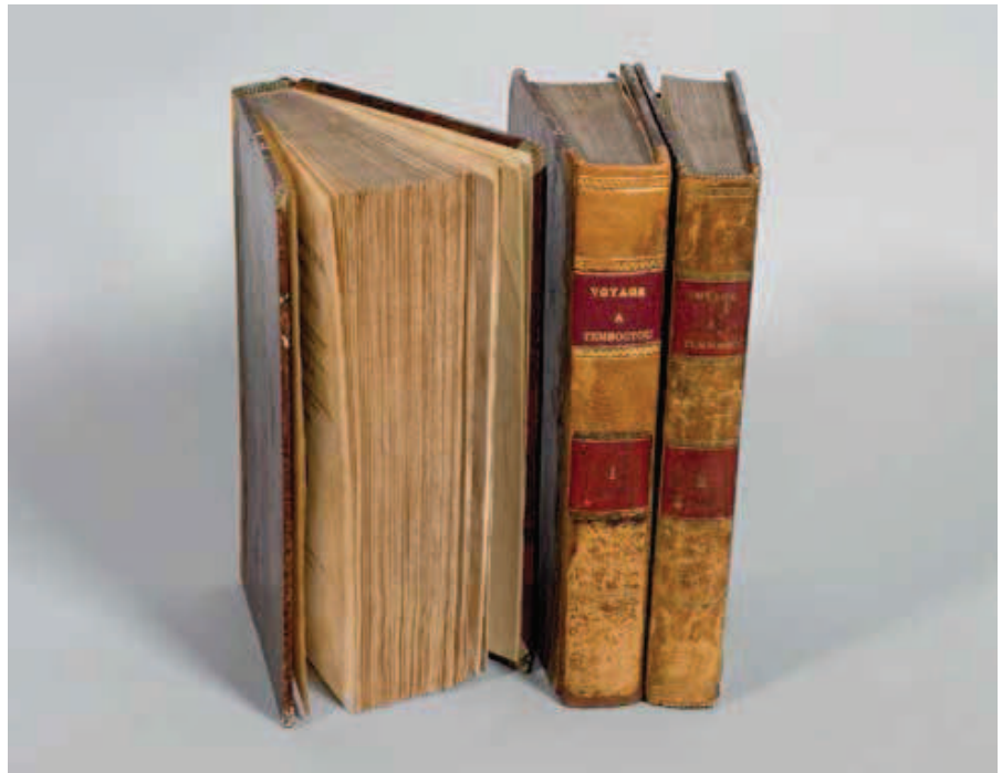
407 CAILLIE RENÉ.

Les dialogues du divin Pietro Aretino , 1879-1880, in-16. Editions Liseux à Paris puis Londres. En 6 volumes. Demi-marquin à coins bleus, dos à nerfs richement orné, couverture conservée. Bel exemplaire. CHF 300 | 400 € 250 | 330